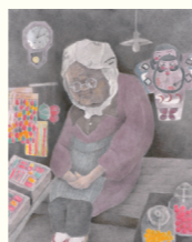
佳作 | イシマルヒデ 「昭和慕情」水彩30号