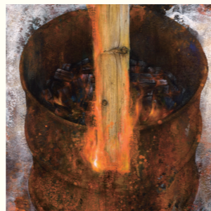
銀賞 | 池上武男 「継がれしモノと積もる澱」 ミクストメディアS30号