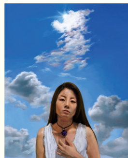
銀賞 | 湯澤美麻 「煌々」油彩30号