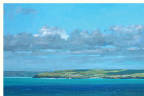
銅賞 | 入江英三 「St.Ivesの風」油彩M30号